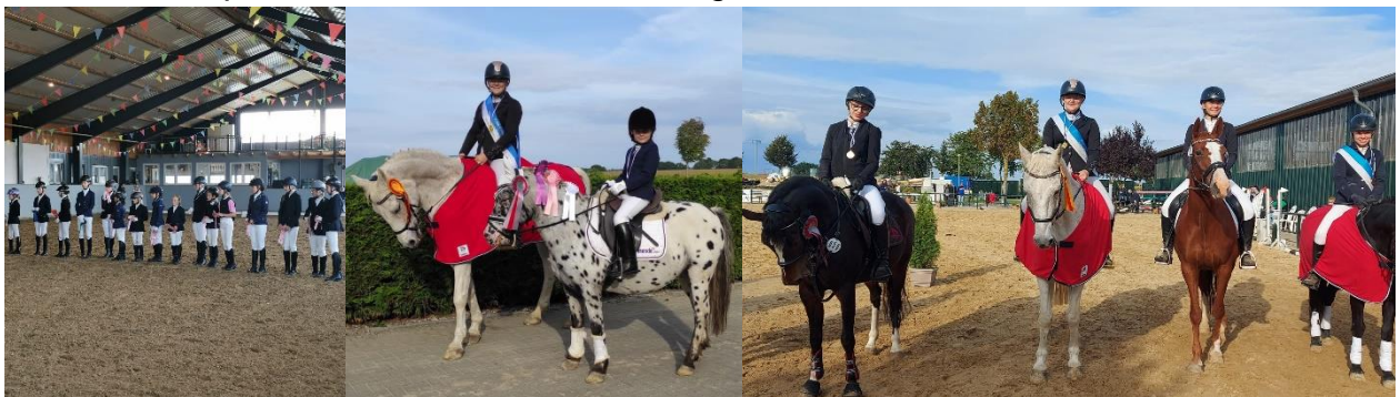
Fotos: Impressionen des vergangenen Reitertages in Elmenhorst