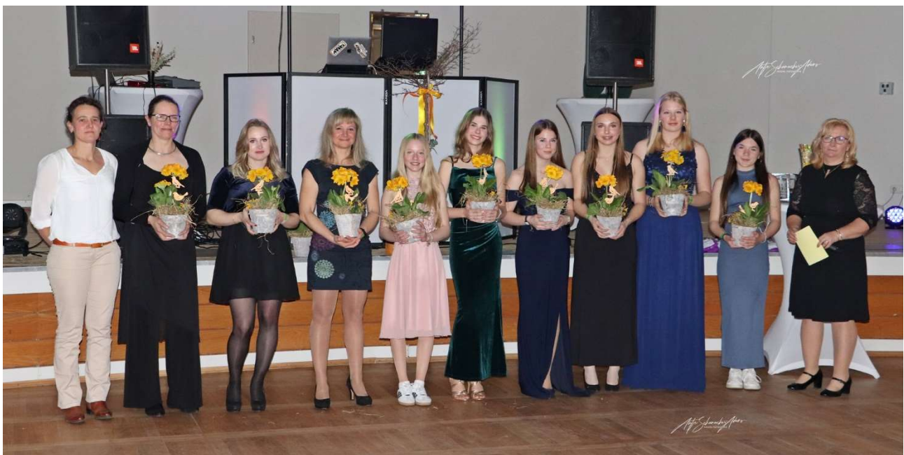
Foto: (1) Gewinner VR-Cup Springen, (2) Gewinner VR-Cup Dressur, (3) alle Platzierten des Abends